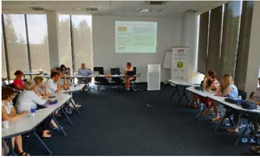
Воркшоп «Інтерактивні методи навчання та віртуальне навчальне середовище»

Під час перебування учасників стажування у Латвійському університеті природничих наук і технологій в м. Єлгава, що в 40 км. від Риги, відбулася екскурсія цим навчальним закладом. Університет знаходиться в старовинному Єлгавському Замку, який був побудований у XVIII ст., тому атмосфера в стінах університету дивовижна. Так, старовинний інтер'єр дуже гармонійно поєднаний із сучасними елементами декору та технологіями XXI століття, а навчальні аудиторії університету обладнані сучасними технологічними засобами. В університеті навчається 4 тис. студентів, навчальний процес забезпечує 1000 осіб персоналу, в т.ч. 300 викладачів. Університет займає 4 місце в рейтингу серед ВНЗ Латвії, проводить активну науково-дослідницьку та проектну діяльність, має власні наукові видання, що індексуються у Scopus та WoS. Одним з нових напрямів діяльності університету є біоекономіка. З 2017 року в Латвії реалізується Стратегія розвитку біоекономіки-2030, тому даний напрямок досліджень є актуальним.