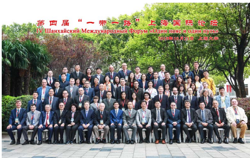
Учасники IV Шанхайського Міжнародного Форуму «Один пояс і один шлях»