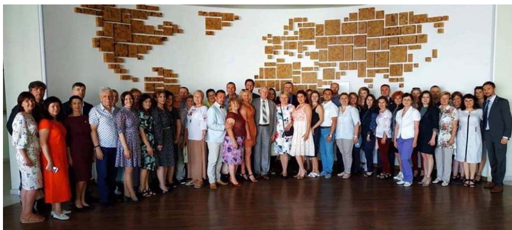
Учасники стажування в Університеті імені Миколаса Ромеріса (м. Вільнюс)

Вже другий рік поспіль основним заходом стажування є міжнародна науково-практична конференція «Міжнародна безпека в світлі сучасних глобальних викликів», яка проводилася в Університеті імені Миколаса Ромеріса