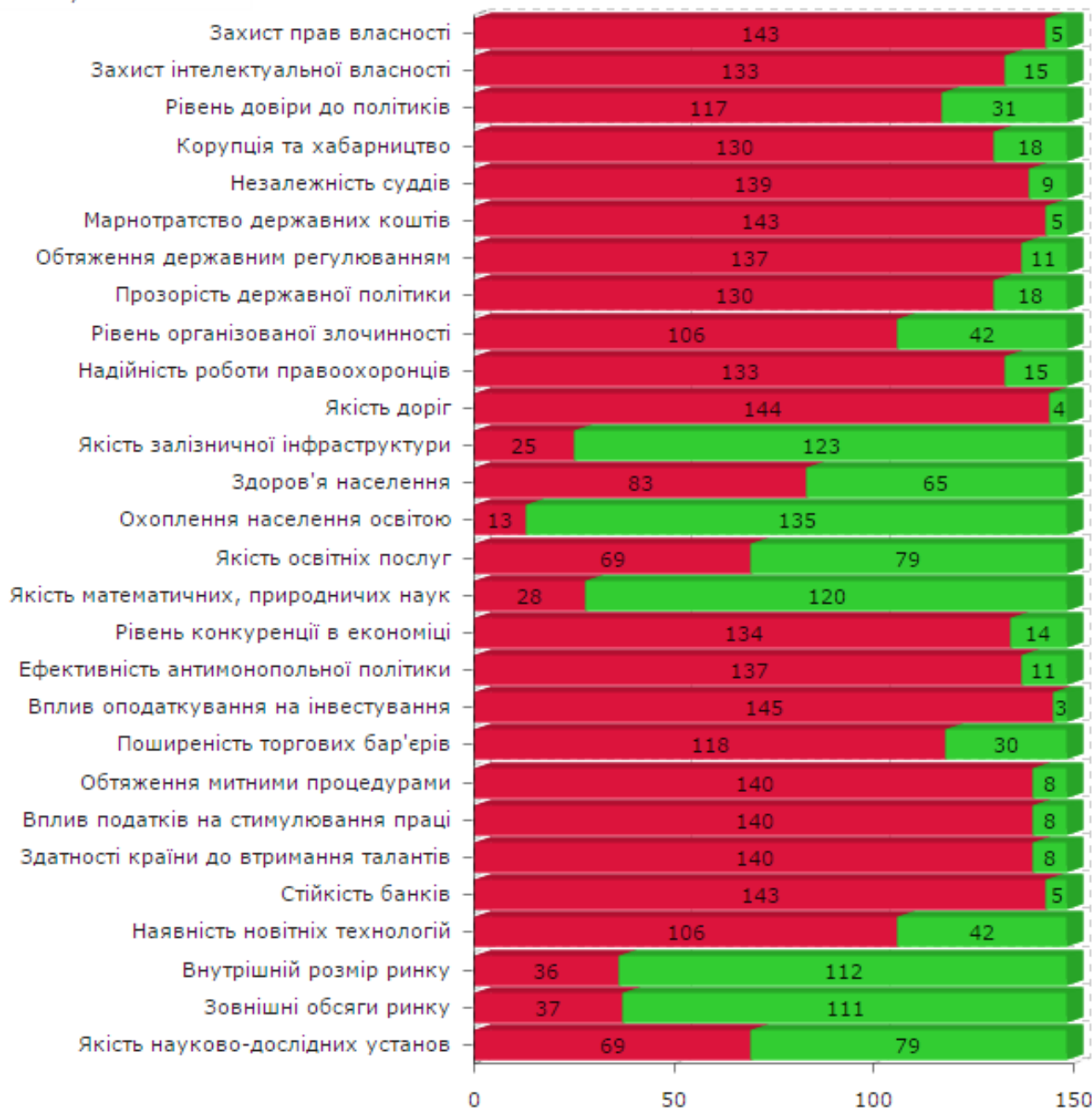
chart by amcharts.com